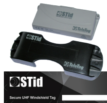
TeleTag® / ETA v2 Tags amovibles & étiquettes pare-brises