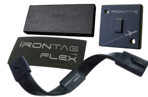
IronTag® Tags métal durcis et souples