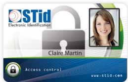
CCT Badges RFID & HYBRIDES